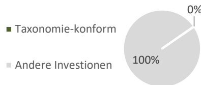
1. Taxonomie-Konformität der Investitionen einschließlich Staatsanleihen*